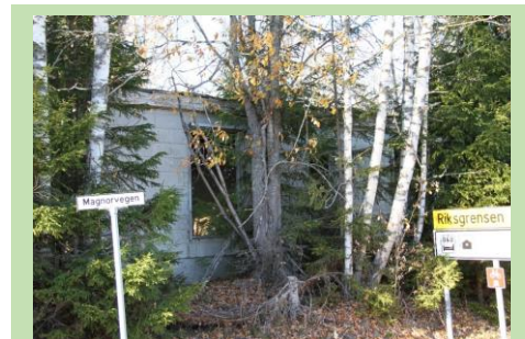
Hvert år er det mange bygninger som går tapt. For hver bygning mister samfunnet en del av sin historie.

Kulturminner kan brukes aktivt i omsorgsarbeid, rundt aktiviteter og som en del av et behandlingstilbud. Kulturminnenes historie kan virke stimulerende og styrke den mentale helsen.