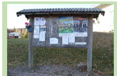
Å kikke på oppslagstavler gir god innsikt om hva som skjer i bygda. Det kan også være et framtidig kulturminne.

Sentralisering og fortetting i eksisterende tettstedsområder skaper utfordringer for kulturminnene. Dette gjør ofte store utslag i kommunesentrene Skarnes og Kongsvinger. Utviklingen innebærer gjerne en fortetting som kan