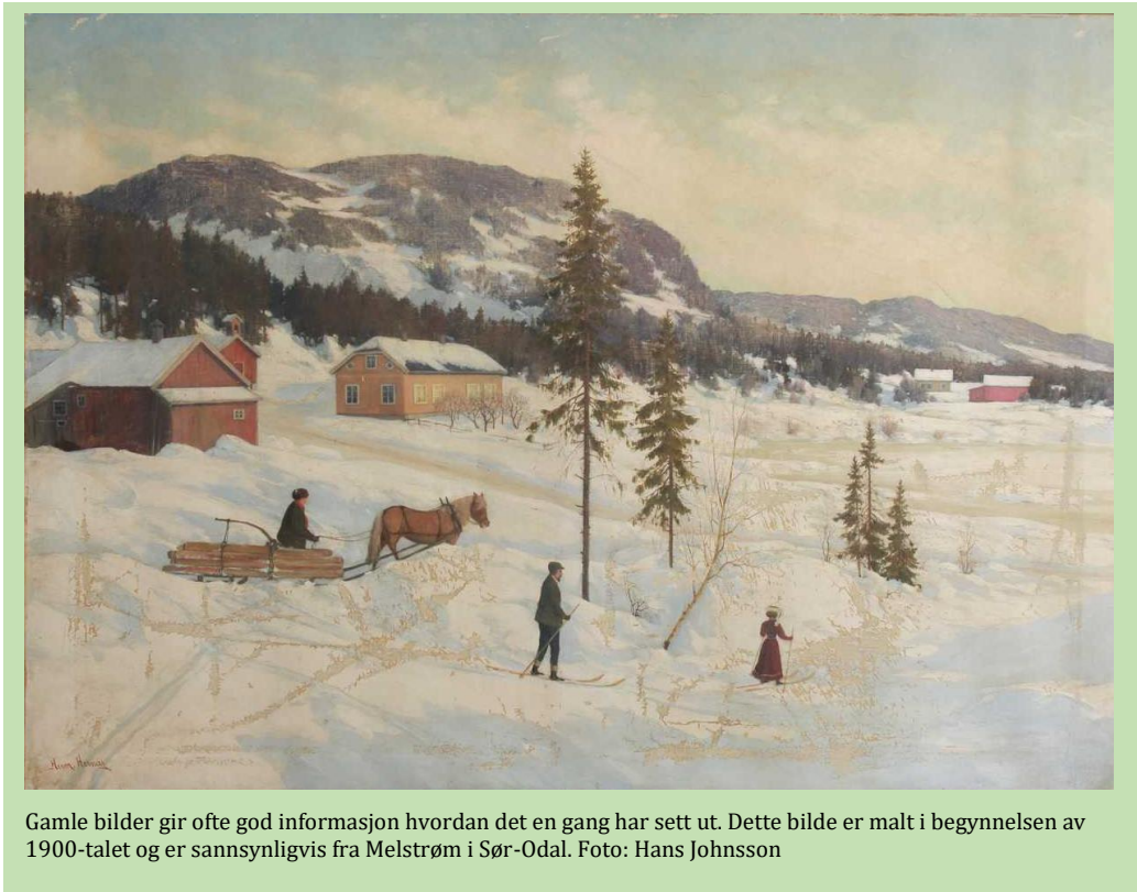
Gamle bilder gir ofte god informasjon hvordan det en gang har sett ut. Dette bilde er malt i begynnelsen av 1900-talet og er sannsynligvis fra Melstrøm i Sør-Odal.

I kommunedelplanen for kulturminner for Kongsvinger og Sør-Odal er det også vist til den felles historien som kommunene har. Glomma har som for Kongsvinger viktig betydning for Sør-Odal. Sikring av eksisterende og oppretting av nye siktlinjer ned til Glomma er viktig utfra mange aspekter, ikke bare som landskapsbildet uten også for å skape en generell økt attraktivitet i bygda.