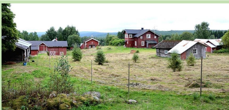
Den skogfinske gården Orala som siden 2019 er fredet.

Norsk Skogfinsk Museum har tilholdssted på Svullrya i Grue kommune. Norsk Skogfinsk Museum er en konsolidering av fire eldre kulturverninstusjoner som arbeidet med skogfinsk historie og kultur: Gruetunet Museum (etablert 1942), Finnetunet (etablert 1942), Austmarka Historielag (etablert 1977) og Åsnes Finnskog Historielag (etablert 1990). Disse fire institusjonene stiftet Norsk Skogfinsk Museum i desember 2005.