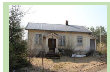
En av mange bygninger som står rundt om oss og som trenger tiltak for at vi ikke skal miste dem. Her Bergersæter skole, en viktig bygning å bevare som forteller mye om historien.