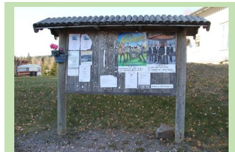
Å kikke på oppslagstavler gir god innsikt om hva som skjer i bygda. Det kan også være et framtidig kulturminne.

Sentralisering og fortetting i eksisterende tettstedsområder skaper utfordringer for kulturminnene. Dette gjør ofte store utslag i kommunesentrene Skarnes og Kongsvinger. Utviklingen innebærer gjerne en fortetting som kan