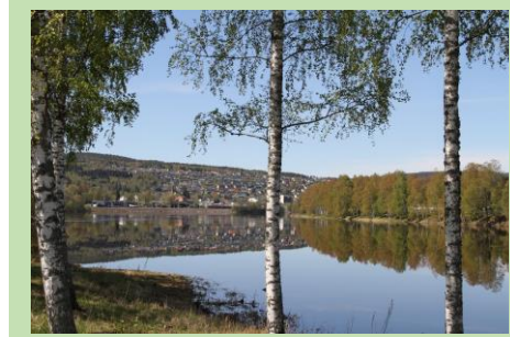
Mange av våre kulturminner er knyttet til Glomma.

Energisparing er et annet innsatsområde som berører den eldre bygningsmassen. Enova har sterkt oppfordret til utskifting av eldre vinduer og etter isolering av eldre bygninger for å redusere energiforbruket knyttet til oppvarming av bygningene. Rådene som gis er ofte i konflikt med kulturminneverninteressene. Å restaurere en bygning eller å gjenbruke materialer fra en gammel bygning innebærer store miljøgevinster i forhold til å rive eller bygge nytt.