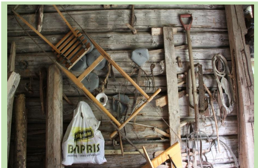
I mange av de gamle bygningene finnes ofte mange gjenstander som er viktig å ta vare på ettertida.

Kulturminnemeldingen «Framtid med fotfeste», (St.meld. nr. 35, 2012-2013) er en oppfølging av den forrige stortingsmeldingen. Meldingen er grunnlag for en mer helhetlig kulturminnepolitikk, både for planlegging, utvalg og restaurering, samt at klimaendringenes påvirkning på kulturminner blir grundig belyst.